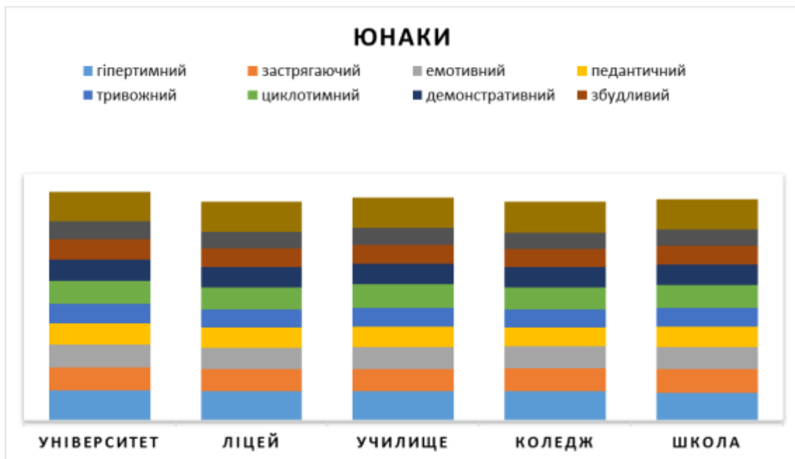
Рис. 2. Основні величини показників типів АХ юнаків сучасних закладів освіти різних типів за даними особистісного опитувальника Шмишека, юнаки

Оцінюючи результати показників рівня прояву особливостей АХ за екзальтованим типом, досліджено, що їх значення становлять 16,47 \pm 0,77 бали у юнаків та 14,17 \pm 0,62 балів (1,5%; p(t)_{ун} > 0,05 ) у дівчат університету, 17,07 \pm 0,87 балів у юнаків та 15,30 \pm 1,07 балів (1,8%; p(t)_{л} > 0,05 ) у дівчат ліцею, 16,83 \pm 0,79 балів у юнаків та 14,37 \pm 0,72 балів (1,3%; p(t)_{уч} > 0,05 ) у дівчат училища, 17,23 \pm 0,89 балів у юнаків та 14,87 \pm 0,87 балів (1,5%; p(t)_{к} > 0,05 ) у дівчат коледжу, а також 17,10 \pm 0,84 балів у юнаків та 14,60 \pm 0,78 балів (1,2%; p(t)_{ш} > 0,05 ) у дівчат школи.