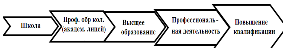
Рис. 1. Непрерывность профессионального развития

В школьном учебном процессе интерес к профессии учителя, в частности, учителя информатики, следующие положения являются причиной для будущего овладения данной профессией: