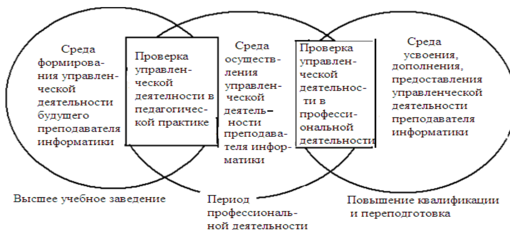
Рис. 2. Непрерывное формирование управленческой деятельности преподавателя информатики

Таким образом, система подготовки преподавателя информатики включает в себя взаимосвязанные в методике преподавания информатики такие этапы, как высшее образование, профессиональная деятельность, повышение квалификации и переподготовка (рис. 2).