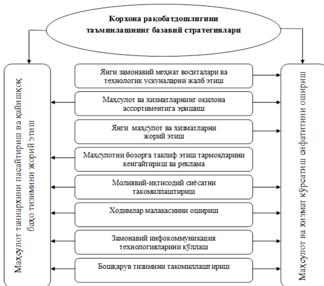
Расм. 1. Корхона рақобат устунликларига эришишнинг базавий стратегияси вазифалари 3

Айрим иқтисодчилар томонидан корхона бошқарувининг тезкор даражасида маҳсулот рақобатдошлиги таъминланса, тактик даражада корхона рақобатдошлиги ва стратегик даражада корхона қийматини оширишга эришилиши таъкидланади 2 .