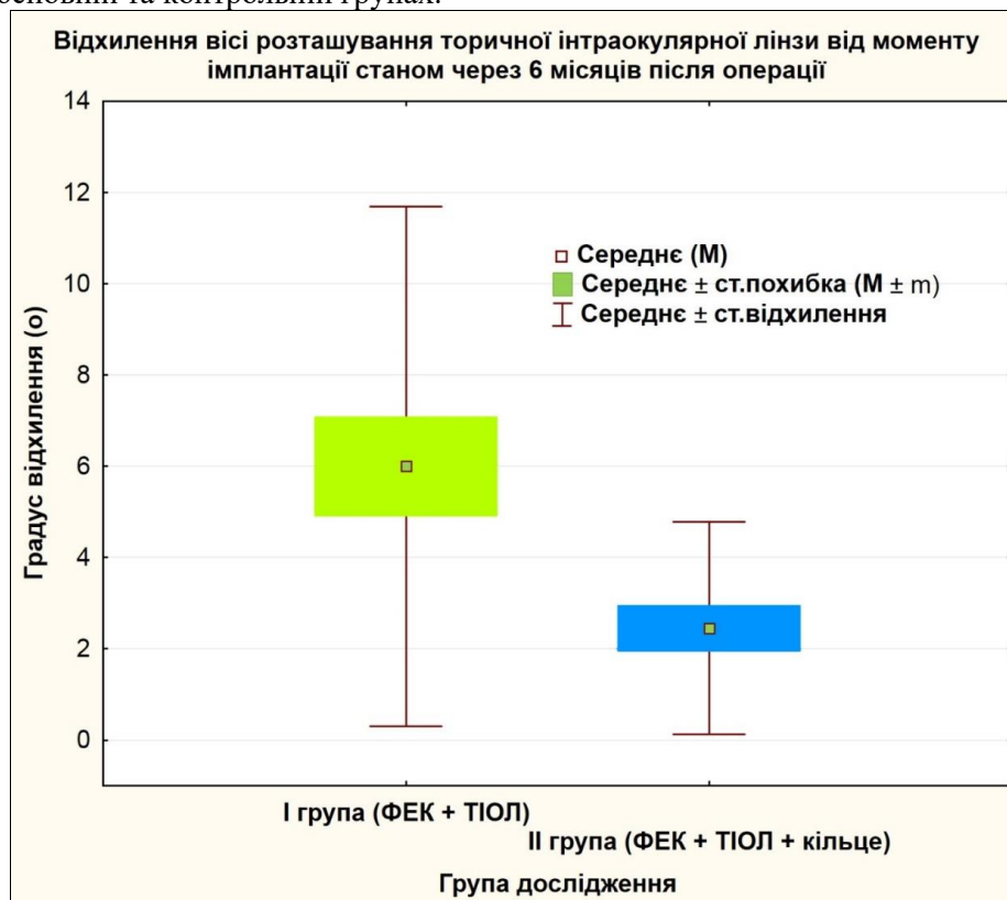
Рис.2. Середні значення та розбій показників відхилення вісі положення торичної інтраокулярної лінзи через 6 міс. після ФЕК в досліджуваних групах ( p < 0,05 ).

На рисунку 2 представлені результати відхилення вісі ТІОЛ через 6 місяців після операції в основній та контрольній групах.