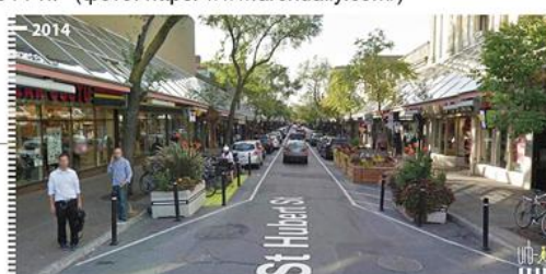
ул.Св.Руберта, Монреаль, Канада, 2014 - 2014 гг.