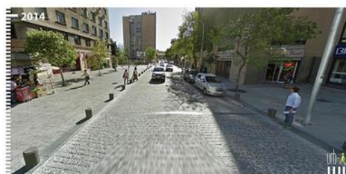
Падре Алонсо де Овалле Сантьяго, Чили, 2013 - 2014 гг.