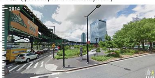
Датч Килз Грин, Нью Йорк, США, 2009 - 2014 гг.