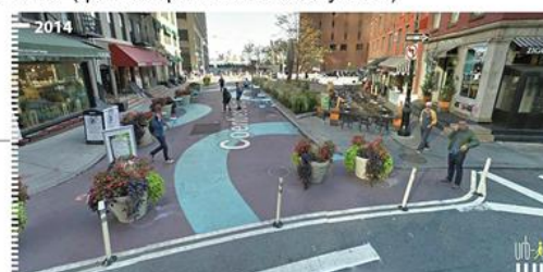
Коэнтиос Слип, Нью Йорк, США, 2012 - 2014 гг.