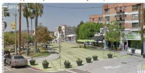
Грифитс Парк Бульвар, Лос Анджелес, США, 2011 - 2012 гг.