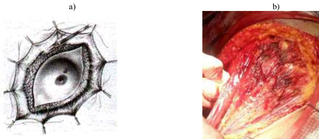
Рис. 1. Напівмісяцевий доступ при радикальній мастектомії: а – схема, б – інтраопераційне фото після видалення грудної залози

При виконанні мастектомії хворих групи порівняння традиційним був доступ, коли двома напівмісяцевими розрізами розсікаються тканини і мобілізується грудна залоза. Даний доступ дозволяє виконати радикальну операцію з лімфодисекцією (рис. 1).