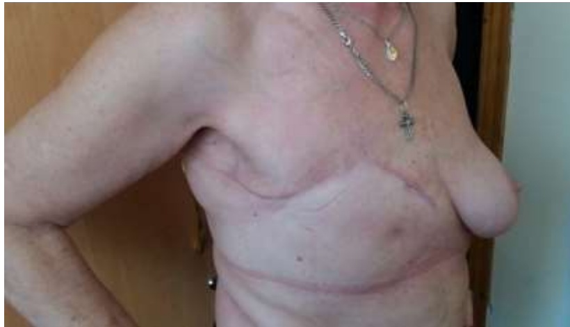
Рис. 3. Пацієнтка Т, 72 років, через місяць після правобічної радикальної мастектомії за Мадденом із застосуванням зигзагоподібного доступу

Як представлено на рисунку 4 у хворих після радикальної мастектомії за Мадденом із застосуванням зигзагоподібного доступу досягається максимально фізіологічним співставлення тканин операційної рани, що сприяє більш швидкій реабілітації та більш швидкому відновленню хворих в післяопераційному періоді. Слід зазначити, що в порівнянні з традиційним доступом, де натяжіння йде вздовж усієї лінії швів, зигзагоподібний доступ забезпечує розподіл натяжіння між швами, тому що максимальне натяжіння тканин відмічається при накладанні вузлів ВС та EF. Це дозволяє зменшити обмеження обсягу рухів в плечовому суглобі за рахунок зменшення сили натяжіння шкіри та підшкірно-жирової клітковини в порівнянні з традиційними методиками ушивання операційної рани.