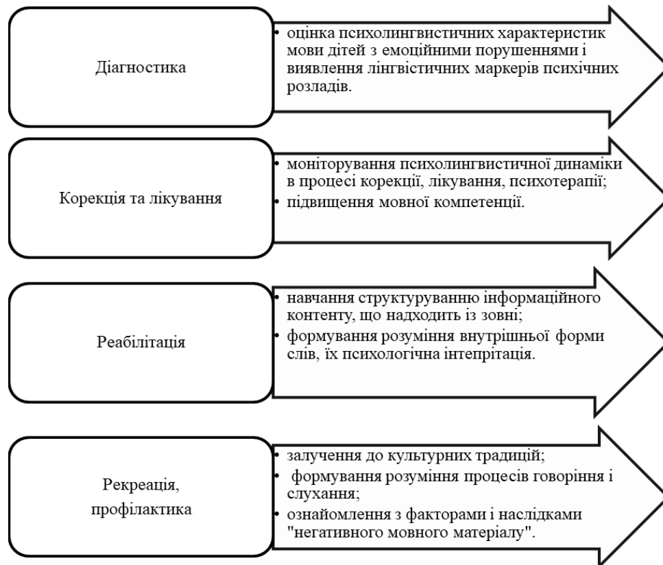
Рис. 2. Психолінгвістичний аспект комплексної медико-психологічної допомоги дітям

Допомога дітям безперечно повинна носити комплексний медико-психологічний характер, і якщо розглядати більш детально, то пропонується розширення уявлень етапів допомоги, а саме: діагностичний, оціночно-планований, лікувально-корекційний, підсумково-рекомендаційний, рекреаційно-профілактичний етапи. Організація процесу полягає в наданні допомоги дітям та їх батькам, як головним суб'єктам процесу цілковитого і багатостороннього розвитку. У даній системі комплексної допомоги впровадження психолінгвістичних досліджень на діагностичному етапі роботи з дітьми реалізує завдання ідентифікації психоемоційного стану дитини за особливостями її голосу (висота, тембр, ритм, плавність тону), оцінка семантичних конструкцій (вивчення зв'язку слів і людської реальності, переважаючої групи слів, визначення поєднання слова з іншими словами, залежне значення слова від контексту фрази). За результатами цих досліджень буде відбуватися більш точна диференціація психологічного і фізичного стану, планування тактики надання допомоги. Так як буде можливість конкретизувати переважаючий стан, зокрема наявність порушення або гальмування (пасивність). У першому випадку, переважає хвилювання, нервозність, непосидючість, а по-другому – втома, безініціативність, байдужість, апатія. У бесіді тембр голосу може вказувати на відношення до того чи іншого явища, ситуації; відчуває, дитина печаль, горе, роздратування, огиду, страх або спокій, веселощі, радість.