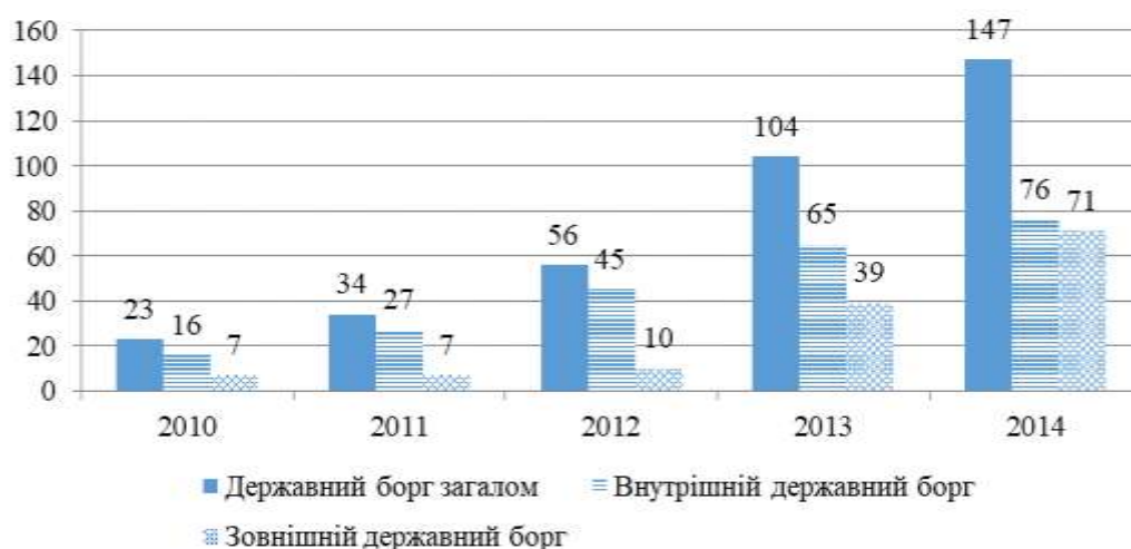
Рис. 2. Динаміка державного боргу Сирії до ВВП протягом 2010-2014 рр. (у %) [13, с. 31]

Відміною рисою сирійського військового конфлікту є те, що через його політичну складову, країна, практично залишилась без можливості отримувати міжнародну фінансову підтримку. Це пов'язано з санкціями, які було накладено розвиненими країнами через позицію керівної верхівки Сирії. У підсумку, закономірно, що розгортання військових дій призвело до зростання витрат державного бюджету. Також поглибив дану кризу стрімкий відплив капіталу з країни, що супроводжувалось практично нульовими інвестиціями. Все це у результаті стало причиною накопичення значного обсягу державного боргу. І хоча на початку війни (у 2011 р.) у його структурі переважала внутрішня складова, станом на 2014 р. вона практично зрівнялась із зовнішньою (рис. 2), при цьому, загальний обсяг боргу по відношенню до ВВП сягнув 147%.