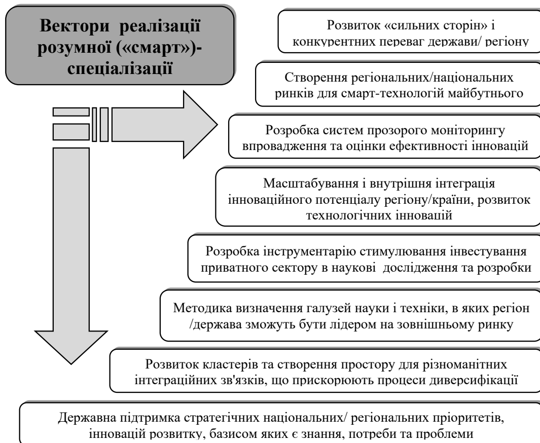
Рис. 2. Вектори реалізації розумної («сма́рт»)-спеціалізації (авторська розробка на основі [3]).

У пропозиції Європейської Комісії щодо політики гуртування на період 2014-2020 рр. потреба в інноваціях є однією із пріоритетних для регіону. Комісія очікує від національних і регіональних органів влади підготовку стратегії досліджень та інновацій в інтересах т. зв. розумної спеціалізації для зміцнення регіональної інноваційної системи, в такий спосіб максимізуючи вигоди від зростання комерціалізації знань у регіоні.