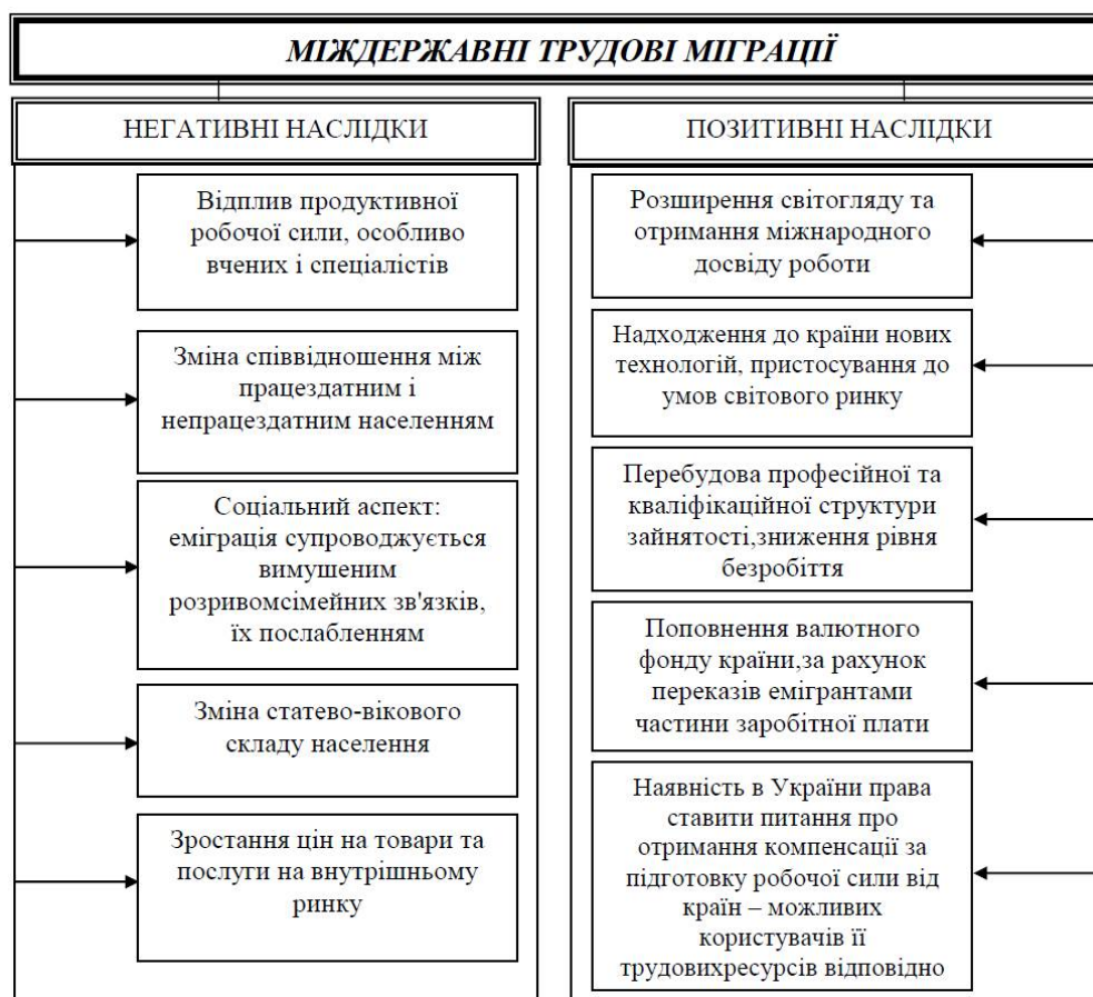
Рис. 2. Схема наслідків міждержавної трудової міграції

Глобалізація істотно змінює сутність міграції, адже процес глобалізації робить характер сучасних переміщень людей латентними, а строки і географічні рамки переміщень – нечіткими. Глобалізація не додає чіткості для розуміння всіх параметрів ідентифікації міграції: часу, відстані, задоволення потреб суб'єктів міграції тощо [2]. Навпаки глобалізація є одним із чинників, який впливає на розвиток сучасних тенденцій міграції, а також визначає специфіку функціонування світового ринку праці.