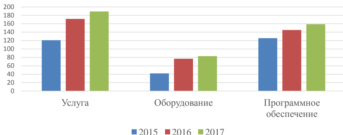
Рис. 1. Сегменты рынка ИКТ в Узбекистане

По данным Международной исследовательской и консалтинговой компании International Data Corporation (IDC), в Узбекистане в 2017 году рынок ИКТ Узбекистана вырос на 6,9 % против роста в 4,8 % в 2016 году. При этом прирост в сегменте услуг – 17,6 %. Сегменты оборудования и программного обеспечения выросли на 6,1 и 13,6 % соответственно. (Рисунок 1).