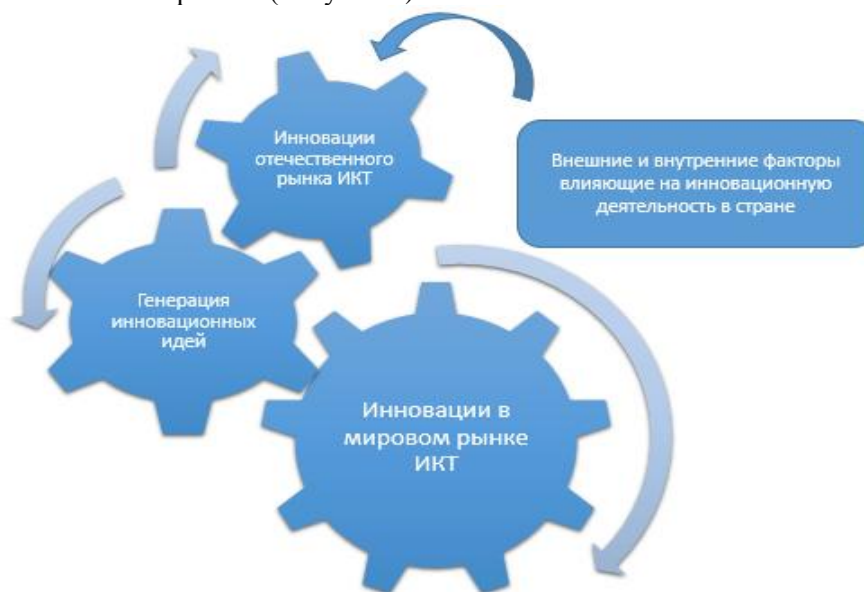
Рис. 4. Факторы влияющие на инновации в отечественном рынке ИКТ

Развитие инновационной деятельности в отечественном рынке ИКТ зависит от нескольких факторов, таких как инновации на мировом рынке ИКТ, внешние и внутренние факторы на отечественном рынке. (Рисунок 4).